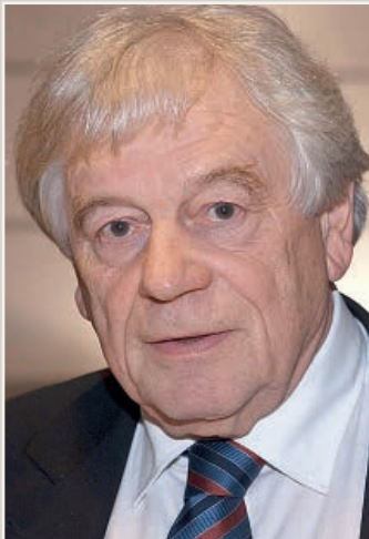
Prof. Dr. Wolfgang Benz Vorsitzender Wissenschaftlicher Beirat